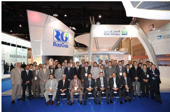
La delegación de Qatar con su Ministro de Industria y Energía, Mohammed Al-Sadam, promocionan el 20º WPC en Gastech

Gastech 2008 se celebró en Bangkok, Tailandia, del 10 al 13 de marzo, con un enorme éxito, atrayendo a 11.500 participantes. El equipo del 19º WPC contó con un stand en la exposición con el fin de promocionar el próximo Congreso y se reunió con diversas compañías para discutir su participación en el evento del mes de junio, incluyendo ADNOC, BP, Brunei LNG, CCC, Chiyoda, ConocoPhillips, ExxonMobil, Pertamina, PTT Group, QatarGas, QatarPetroleum, RasGas, Siemens, STX, Tecnicas Reunidas y Total.