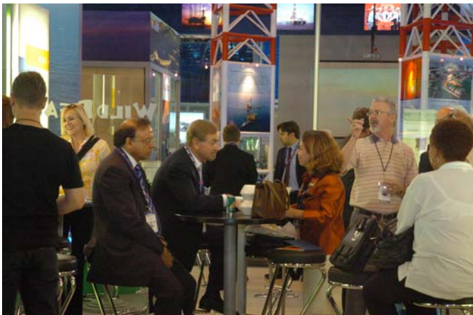
Visitantes confraternizando en la Exposición del 18º WPC