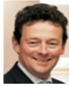
Mr. Tony Hayward Consejero Delegado, BP

Mr. Sergey Bogdanchikov Presidente, Rosneft