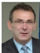
Mr. Andris Piebalgs, Comisario Europeo de Energía