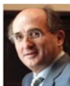
Mr. Antonio Brufau Presidente y Consejero